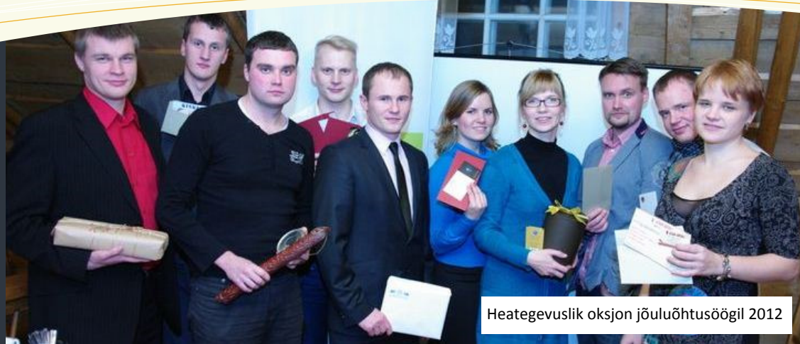
Heategevuslik oksjon jõuluõhtusöögil 2012